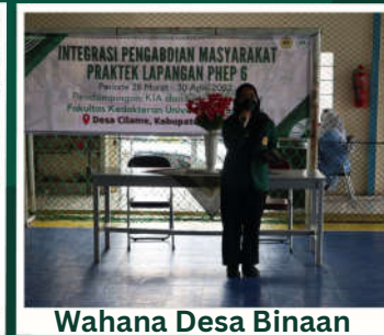
Wahana Desa Binaan