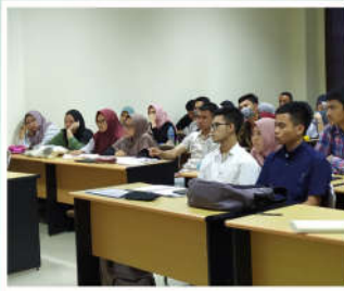
Interactive Conceptual Teaching