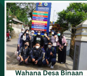
Wahana Desa Binaan