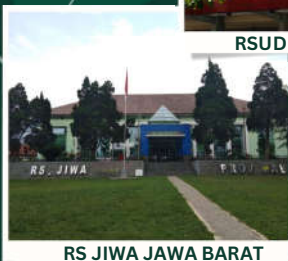
RS JIWA JAWA BARAT