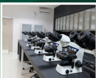
LABORATORIUM BIO MEDIK