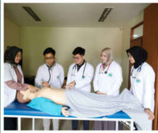
Clinical Skill Lab