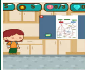
Games Based Learning