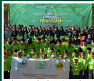
Community Base Learning